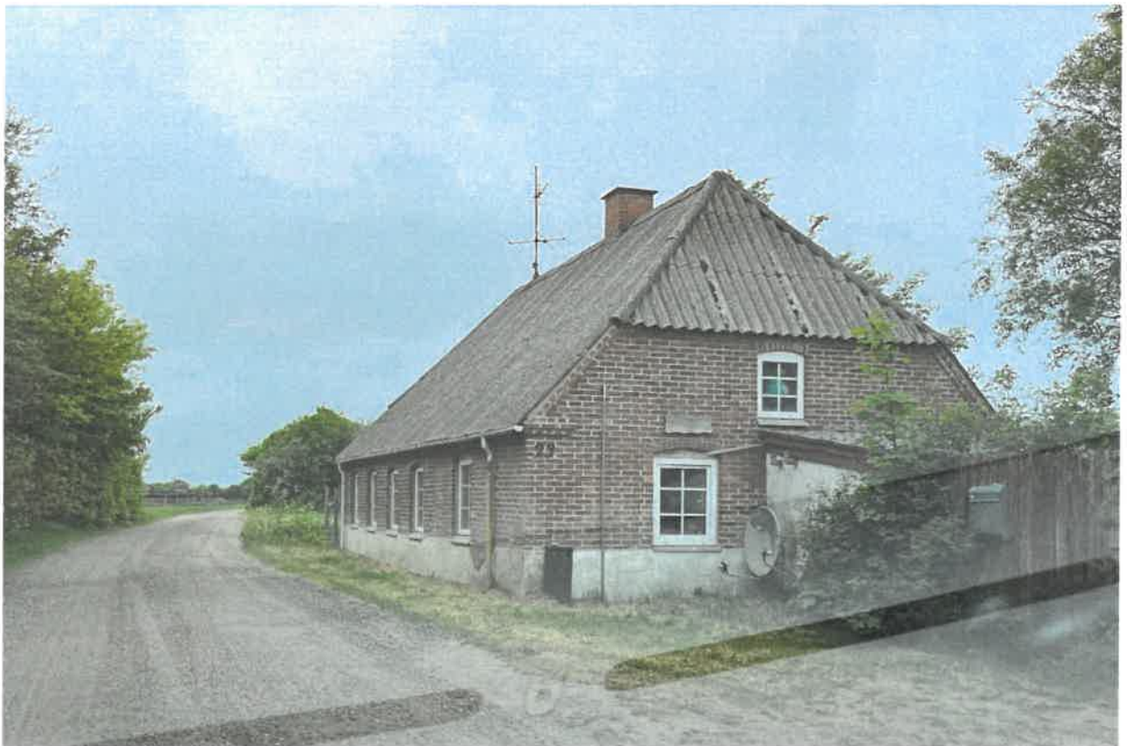
Set fra øst 2023