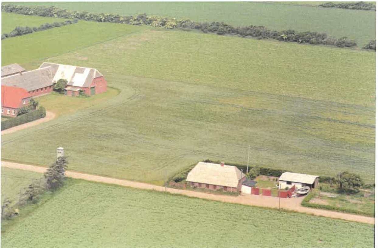
Luffoto 1988, 4 år før SAVE-registrering