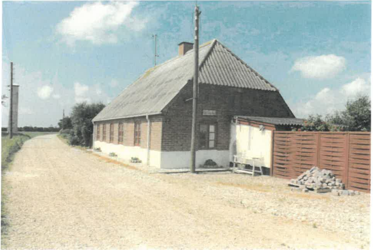
Set fra øst 1992