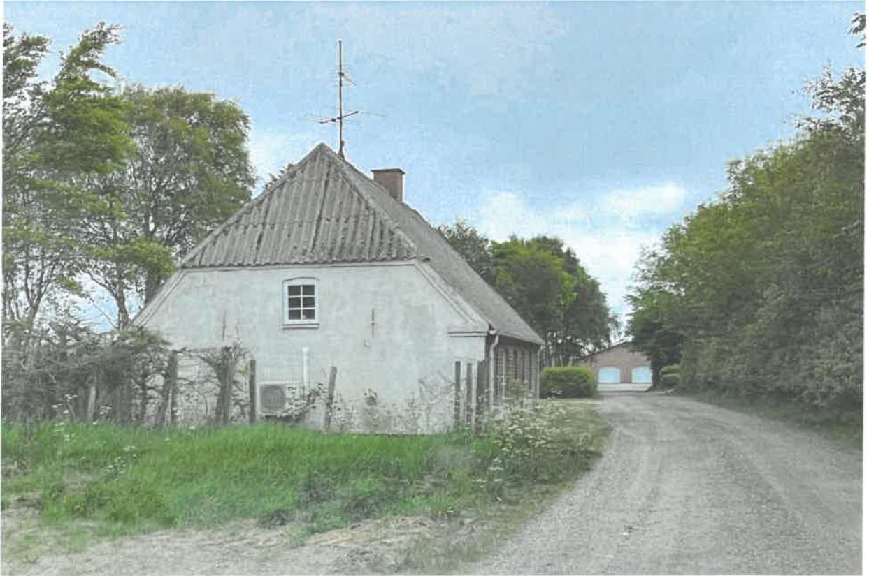
Set fra vest 2023